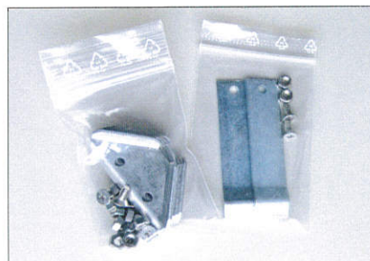
Winkelverbinder und Maueranker werden lose mit dem Winkelrahmen geliefert