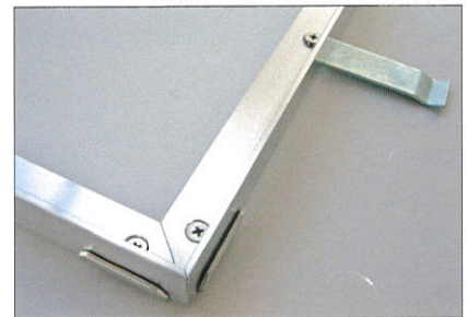
Winkelrahmen mit Eckverbinder und Maueranker (Lieferung erfolgt ohne Montage)